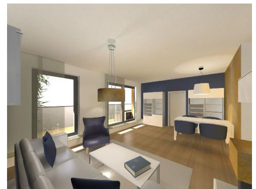
Wohnbereich mit Essplatz