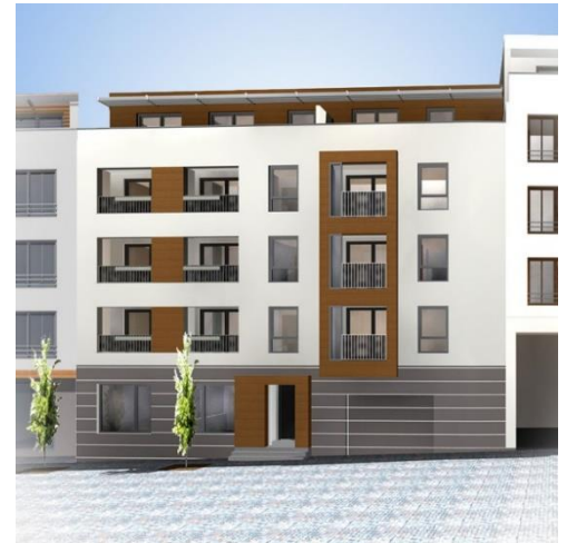
Ansicht Klosterplatz 2