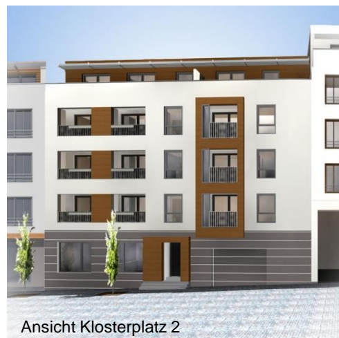
Ansicht Klosterplatz 2