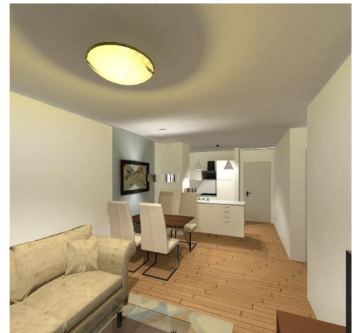
Wohnbereich mit Essplatz