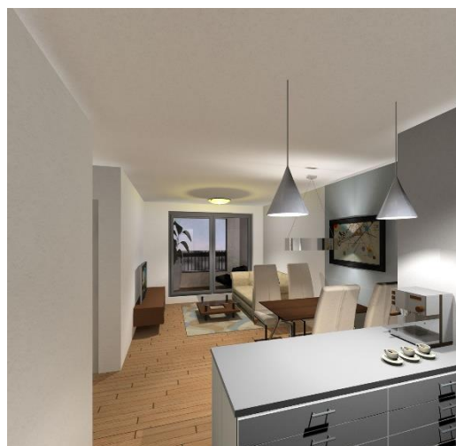
Küche mit Essplatz