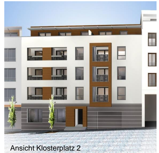
Ansicht Klosterplatz 2