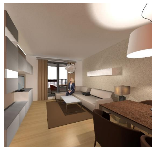
Wohnzimmer mit Essplatz