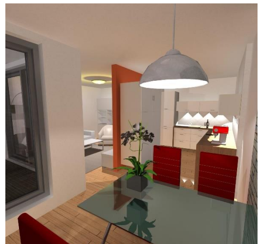
Küche mit Essplatz