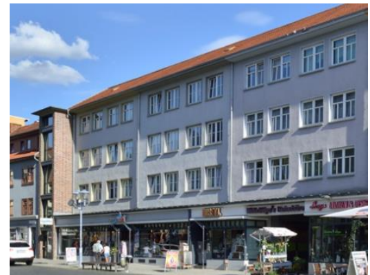
Ansicht Neumarkt 10-18