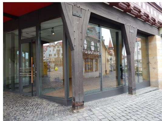
Ansicht der Schaufensterfront