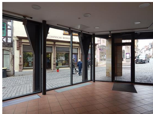
Innenansicht mit Schaufensterfront