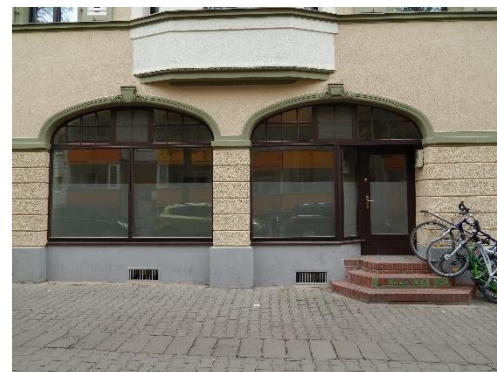
Schaufenster und Eingang