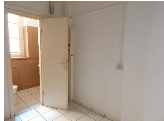
Vorraum und WC