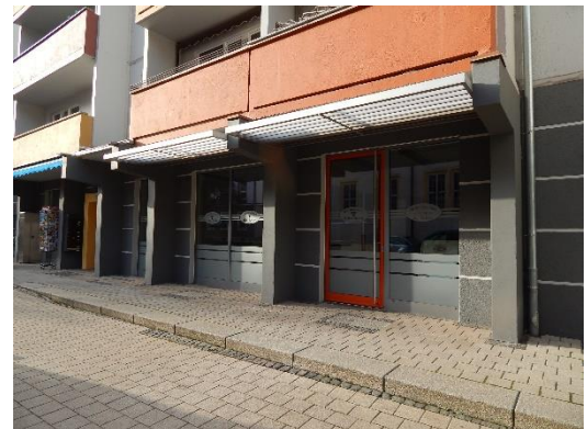
Ansicht der Gewerbeeinheit